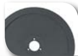
OPTION REVÊTEMENT ANTI-ADHÉRENT TOTAL Evite les dépôts de graisse & facilite le nettoyage CODE 0668