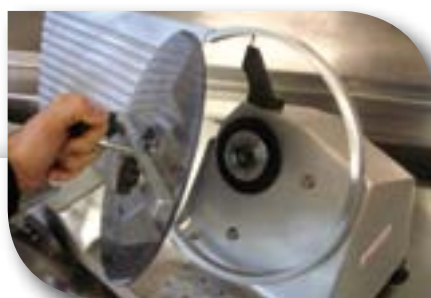
Extraction de la lame sécurisée