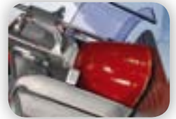
Plateau guide multi-produits