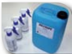
FAST CLEANER Nettoyant dégraissant désinfectant, non agressif 9 flacons pulvérisateur : CODE 0664 1 bidon de 10 litres : CODE 0666