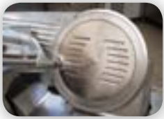
Couvre lame inox (compatible lave vaisselle)