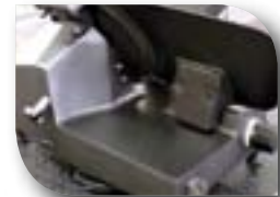
OPTION REVÊTEMENT ANTI-ADHÉRENT Evite les dépôts de graisse & facilite le nettoyage CODE 0668