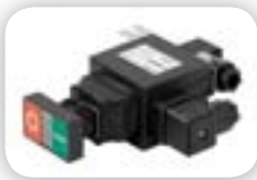
Boutons et carte électronique de commande étanche IP 65