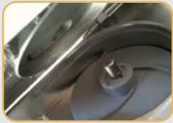
Système de sécurité : arrêt de l'appareil lors de l'ouverture de la trémie ou du levier