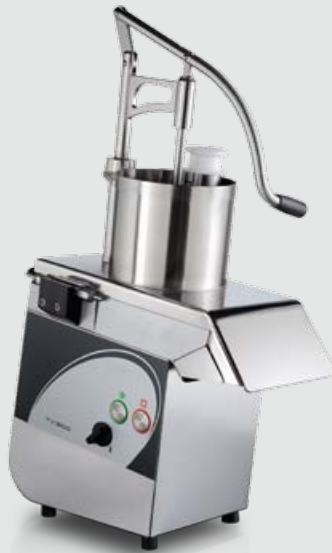
Trémie à levier