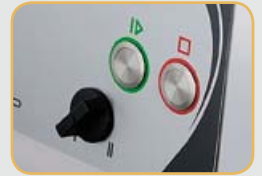
Commandes inox étanches IP 67 Commutateur 2 vitesses étanche IP 65

Nouveau modèle spécial grandes productions. Trémies interchangeables entièrement inox. Grande puissance et rapidité de travail.