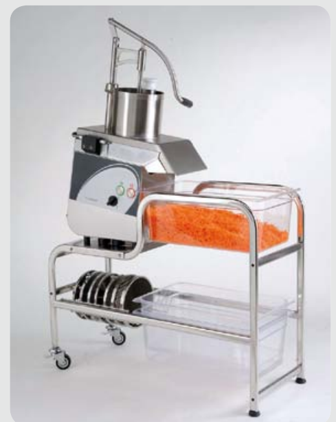
Chariot station de travail inox