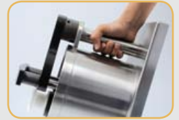
Nettoyage trémie lave vaisselle